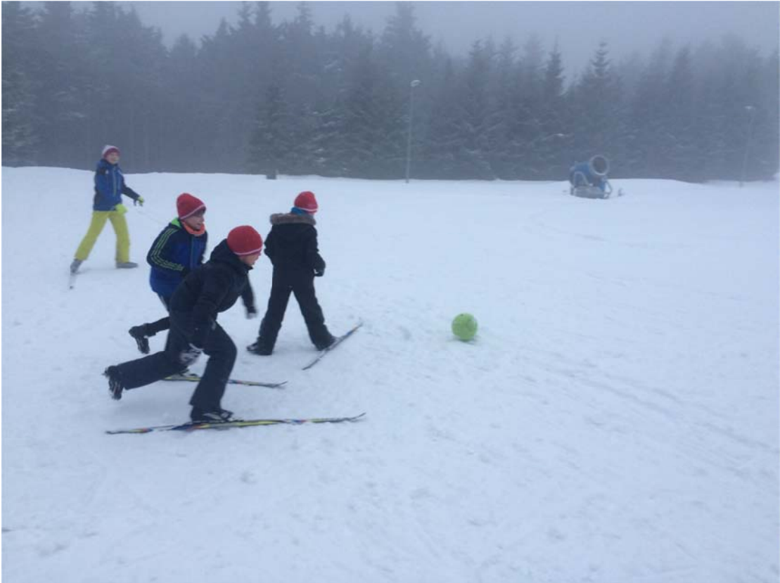
3 Bilder vom Fußballspiel auf Langlaufski