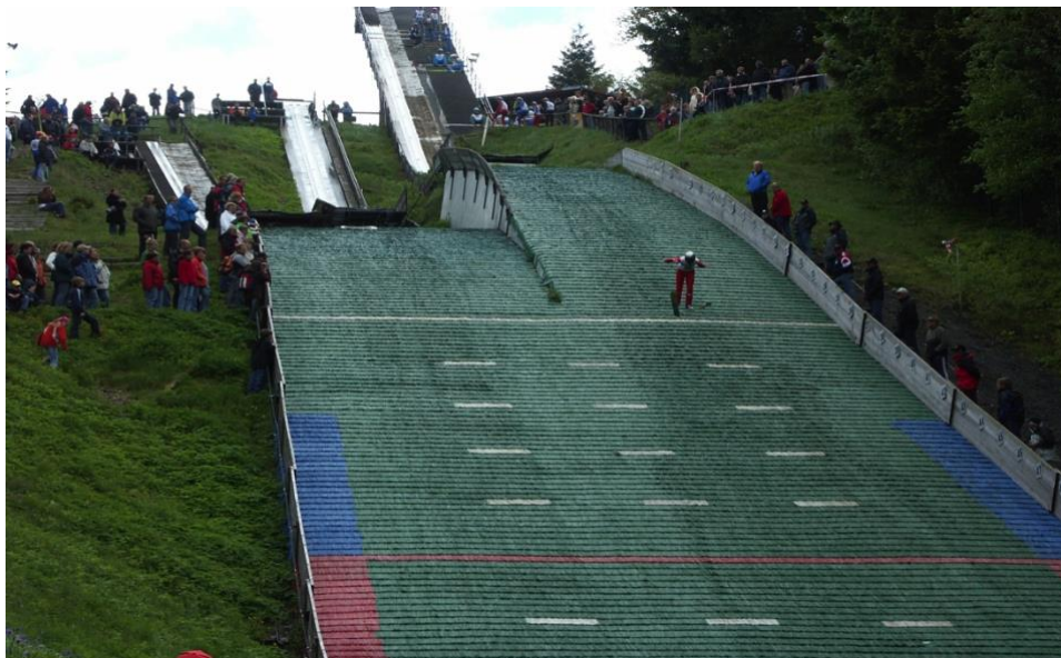
Ausrichter Skiklub Winterberg