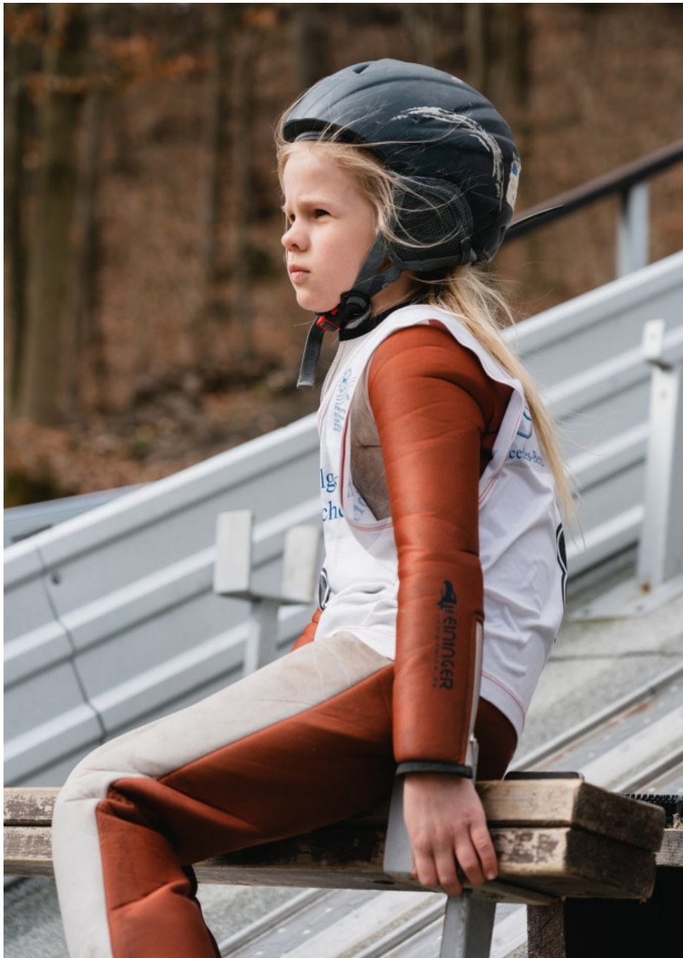
Die Vorbereitung auf den Sprung erfordert Konzentration.