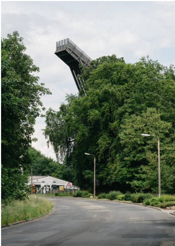
Das Training findet auch im Sommer statt.

Während in den großen alpinen Skigebieten viel Kritik an der wenig nachhaltigen künstlichen Beschneigung und dem Ausbau der Skigebiete geübt wird, zeigt diese Fotoserie eine Alternative dazu auf: Skisport ist auch ohne Schnee möglich.