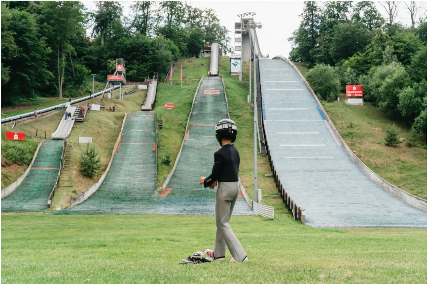
Die vier Schanzen am Papengrund bieten verschiedene Sprungweiten, je nach Erfahrung und Können.