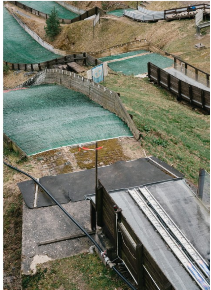
Auf dieser Bahn fährt die junge Skispringerin nach oben zum Start. Am Schanzentisch erfolgt dann der Absprung.